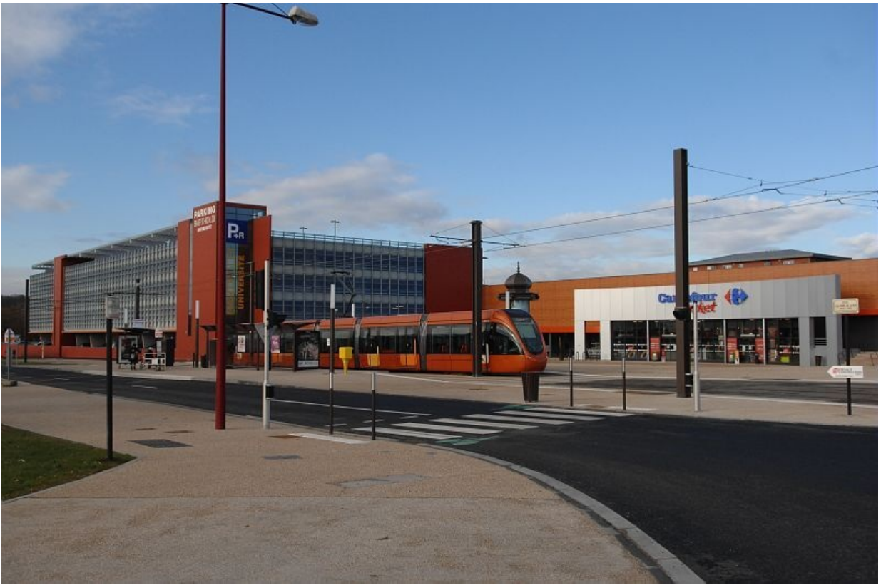
Terminus de la ligne 1 du tramway.