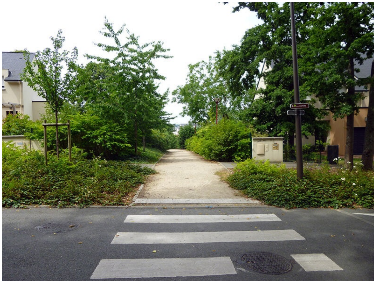
Il est possible de rejoindre Sargé-lès-Le Mans depuis le parc de Banjan via le Boulevard nature, qui traverse la Zac Banjan.