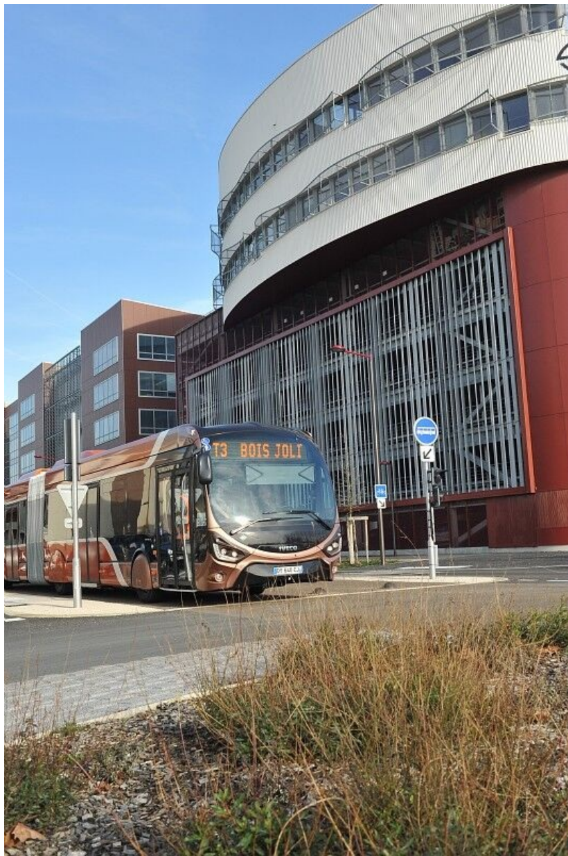
Tempo, bus à haut niveau de service.