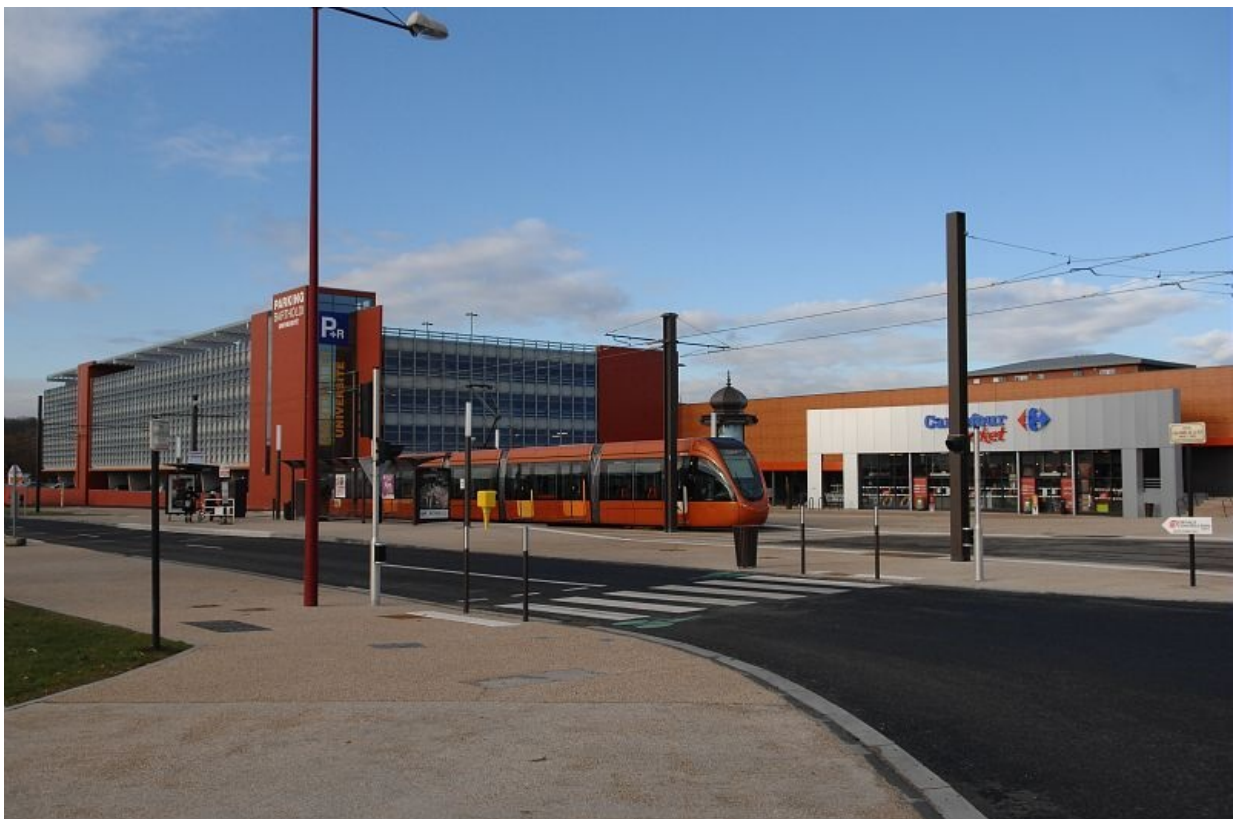
Le parking-relais à l'entrée nord-ouest du Mans.

Pour rejoindre le centre-ville en tramway ou en bus, vous pouvez laisser votre véhicule dans l'un des deux parkings-relais aux entrées de ville.