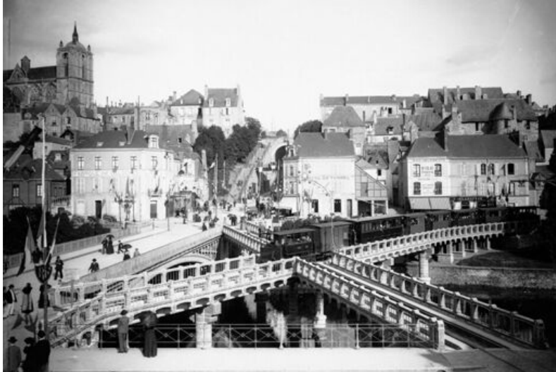
Le pont en X.

Les faubourgs du Mans font l'objet d'études et de recherches menées par le service Patrimoine de la région des Pays de la Loire depuis 2017. L'exposition se propose d'en restituer les éléments les plus marquants afin de raconter la métamorphose complète du Mans entre la fin de l'Ancien Régime et le XX e siècle.