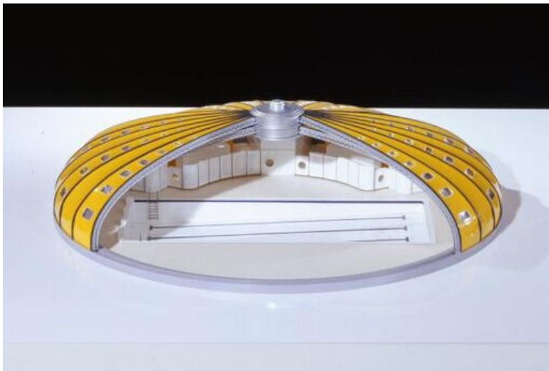
Alessandra Cianchetta (concepteur), Carrafont (maquettiste), Maquette de la piscine Tournesol, 2007, Cité de l'architecture et du patrimoine - Musée des monuments français, Paris. © Gaston et Septet

Cette photographie de 1909 illustre le travail des cigarières de la Manufacture des tabacs à Saint-Georges-du-Plain. Les premières travailleuses, embauchées à partir de 1877, pouvaient confectionner jusqu'à 1000 cigarettes par jour et par ouvrière, avant que l'invention de machines n'augmente drastiquement la productivité. La mouillade est l'une des cinq étapes préliminaires de traitement de la feuille de tabac dans la manufacture. Elle consiste à assouplir les feuilles en les immergeant dans l'eau.