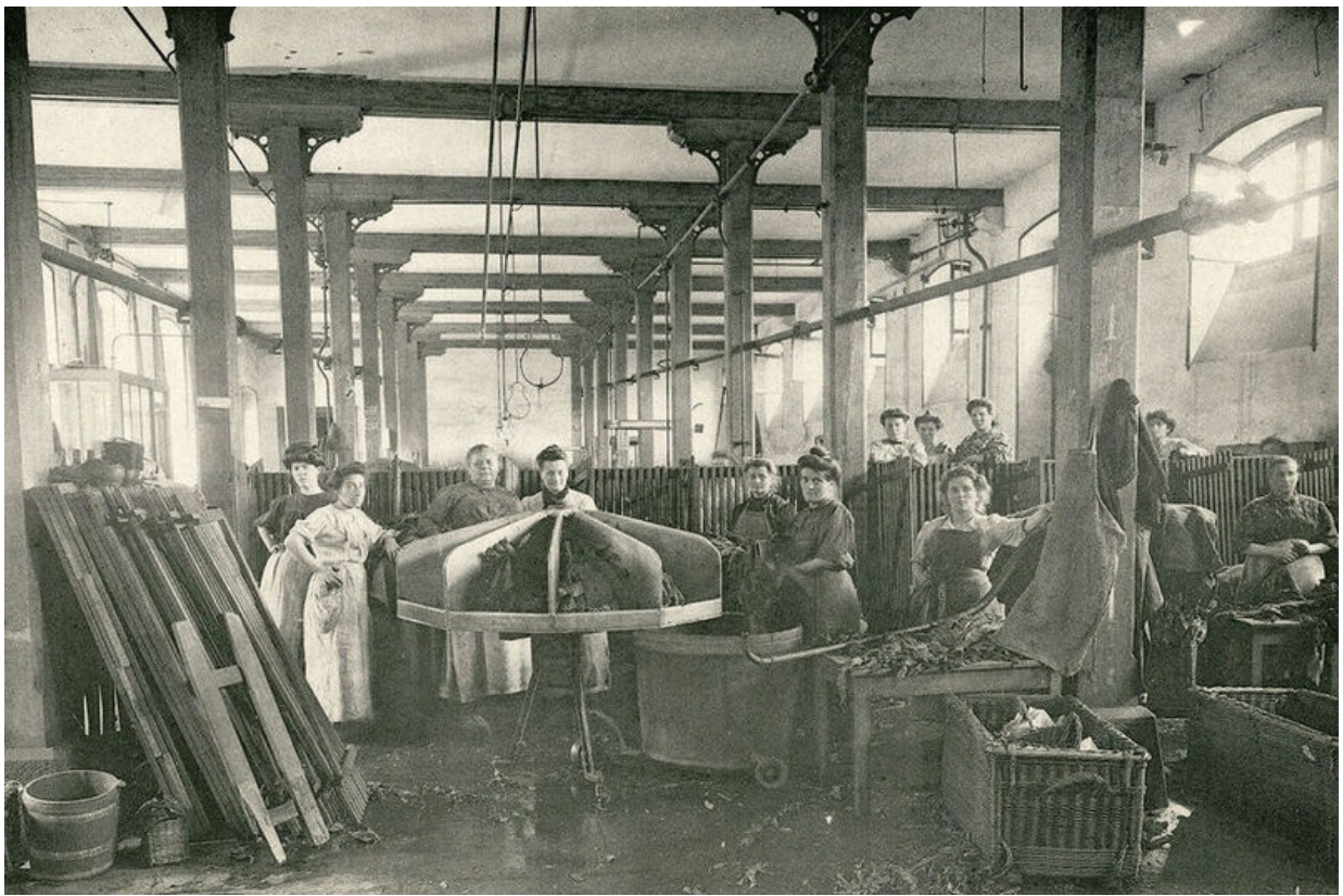
Ouvrières au travail pratiquant la mouillade. Album photographique imprimé par H. et J. Tourte, Levallois-Perret, 1909, encre sur papier, Archives du Mans. © Ville du Mans

Cette photographie de 1909 illustre le travail des cigarières de la Manufacture des tabacs à Saint-Georges-du-Plain. Les premières travailleuses, embauchées à partir de 1877, pouvaient confectionner jusqu'à 1000 cigarettes par jour et par ouvrière, avant que l'invention de machines n'augmente drastiquement la productivité. La mouillade est l'une des cinq étapes préliminaires de traitement de la feuille de tabac dans la manufacture. Elle consiste à assouplir les feuilles en les immergeant dans l'eau.