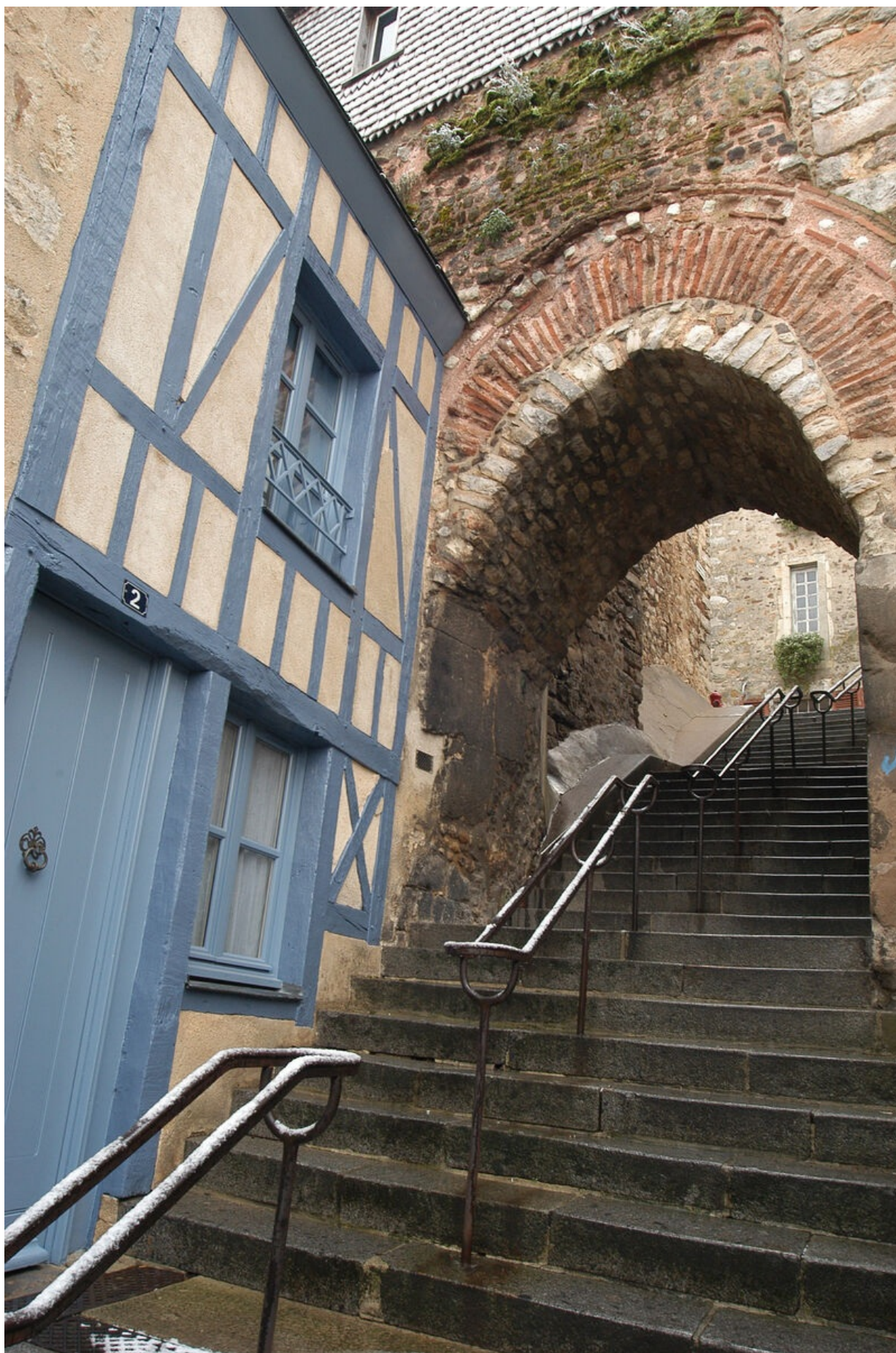
La restauration a permis de sauvegarder une porte et trois poternes.

Au fil du temps, certains pans de la muraille se sont dégradés tandis que d'autres ont été préservés grâce à l'enchevêtrement de masures qui lui étaient accolées. Au cours des années 1970, des travaux de protection et de restauration de l'enceinte sont lancés. Depuis, celle-ci a retrouvé son éclat et se dresse fièrement, tout