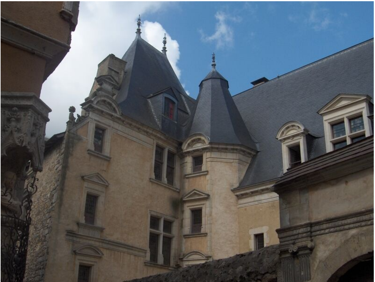
L'hôtel de Vaux.

Le Mans a été le foyer très actif de la Renaissance , grâce à de grands mécènes, ses cardinaux-évêques, Philippe de Luxembourg et Jean du Bellay.