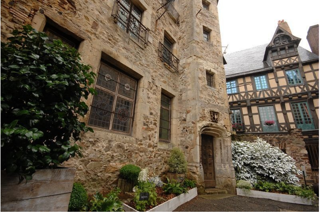
Le bâtiment de la parcelle CR 129.

C'est la contenance totale des deux parcelles proposées à la vente.